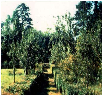
Etat général très envahi