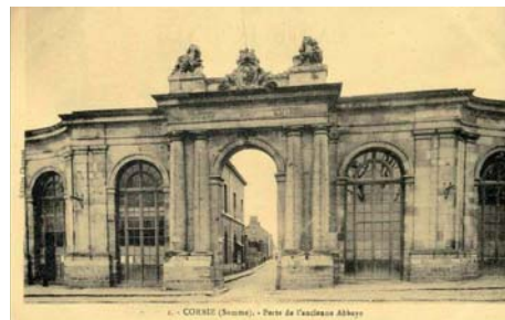
La porte d'honneur, ca 1900