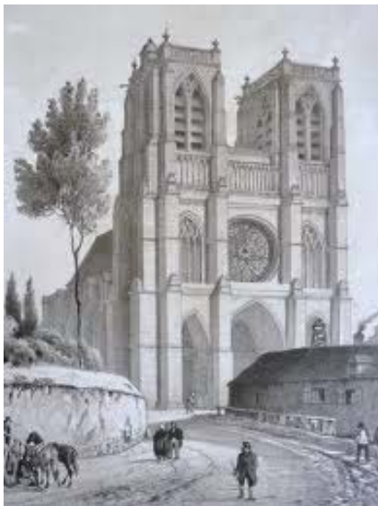
Vue de l'abbaye, est. XIXe

Sur le site chargé d'histoire de l'enclos de l'ancienne abbaye, il s'agit d'inscrire de nouvelles pratiques culturelles et sportives, en respectant "l'esprit des lieux". L'impact d'imposants bâtiments déjà en place est atténué tandis que de nouveaux cheminements traversent le site dont le mur périphérique est par contre réhabilité et ne doit être ouvert que très ponctuellement. Une trame unificatrice de verger fait la liaison entre les différents espaces.