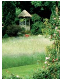
Derrière un mur de Montfort