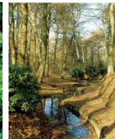
Les "zigs-zags" de Rosay