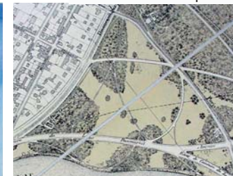
Le site avant création du zoo, 1929