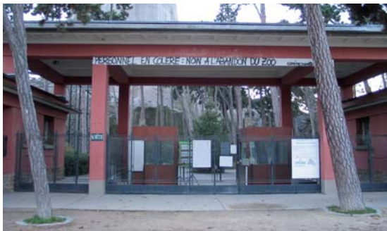
"Personnel en colère: non à l'abandon du zoo", 2004

L'analyse historique, conduite en parallèle à la lecture paysagère et architecturale actuelle, donne de grandes orientations pour l'évolution nécessaire d'un lieu très dégradé et dangereux.