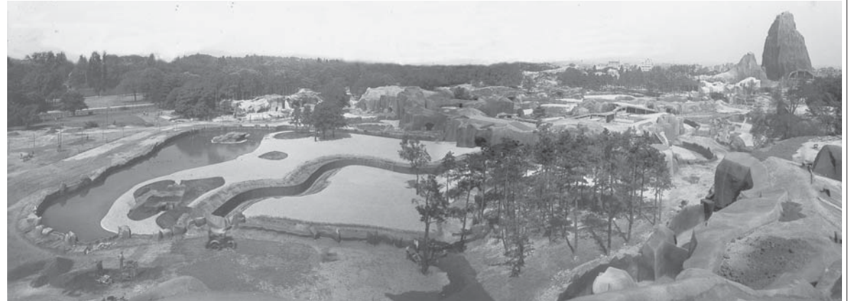
Vue du chantier depuis le rocher des Ours, 1933, Arch. PZP