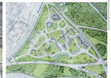
Même plan, 1934.