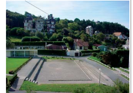
Square de l'Amphithéâtre