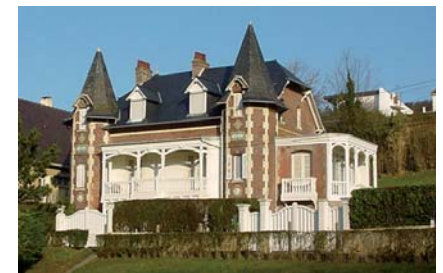
Villa "Belle époque"