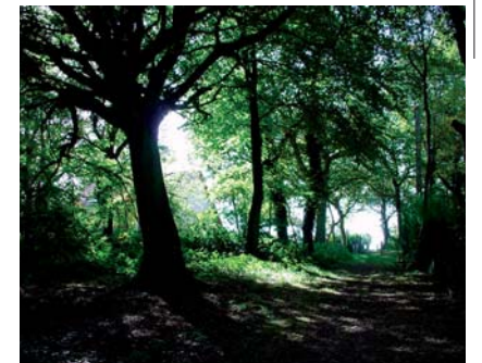
Chemin dans le bois