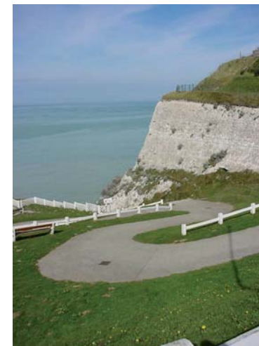
L'impressionnante descente vers la mer