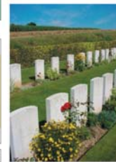
Potentilles, roses, sédums,...

L'ensemble du cimetière est ceinturé d'une haie de hêtres taillée à 0,50m environ. Les stèles sont accompagnées de plantes alpines, roses rouges, sédums, préfaisites, etc. Deux malus et deux taxus ont été enlevés le 25 janvier 1998 ( on peut les voir dans les photographies du guide « Battle ground » : cf biblio ).