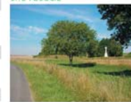
Le mémorial vu depuis la route de Beaumont-Hamel à Auchonvillers